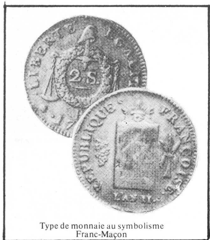
Type de monnaie au symbolisme Franc-Maçon

Voltaire, dans un essai sur l'esprit et les mœurs des nations, prétend qu'elle est le résultat d'une fantaisie de peintre. C'est fort possible et, peut-être, doit on tenir compte de cette opinion.