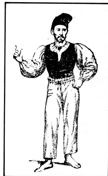
5. Masaniello, d'après une gravure napolitaine de 1647. Le souvenir de ce révolutionnaire avant la lettre reste très vivace à Naples.

A quelques variantes près dans la forme de l'écusson, la description des revers des quatre pièces est la même