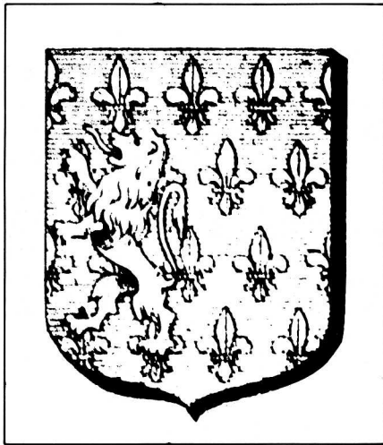
1. Les Armes de Guise. Henri II de Lorraine était le cinquième duc de Guise.

En 1647 un jardinier récalcitrant avait refusé de payer une taxe qu'il jugeait abusive sur les produits de la campagne qui entraient en ville pour y être vendus au marché, le peuple s'était ameuté et le vice-roi, représentant le roi d'Espagne avait jugé bon de fuir l'émeute.