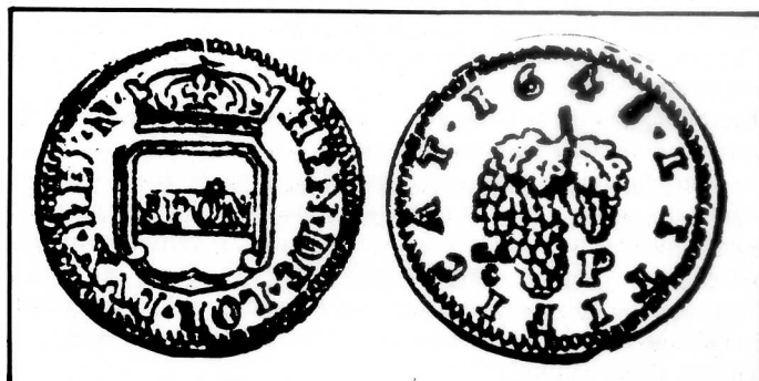
6. La pièce de 1 Tornesi, au décor de grappe de raisin.