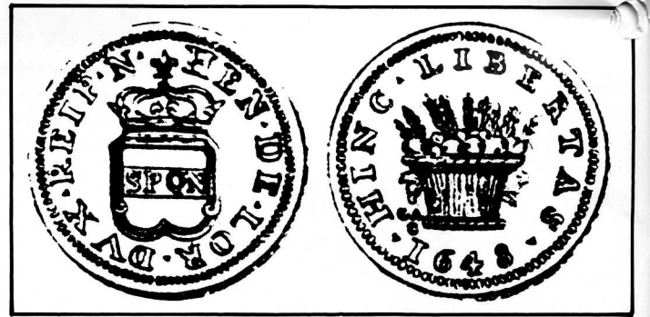
2. La pièce retrouvée dans le Var : monnaie de nécessité en cuivre, de 2 Tornesis, frappée par la ville de Naples, au nom de HENRI DE LORRAINE, DUC DE GUISE, lors de la Révolution de 1648. Sur l'avers : HEN. DE. LOR. DVX. REIP.N. Ecusson couronné, renfermant dans une bande horizontale les lettres : SPQN. Sur le revers : HINC. LIBERTAS - 1648. Dans le champ, une corbeille remplie de fruits et d'épis. En bas, sur le côté les lettres GAC.

Le 6 Avril 1648, Don Juan d'Autriche qui entretenait des intelligences dans la place, entra dans la ville, mettant à profit une absence du Duc. Lorsque celui-ci revint il tomba dans une embuscade et fut capturé. Conduit en Espagne, condamné à mort, il ne fut pas exécuté, faisant valoir cette prérogative, qu'un général ne "devait pas l'être". D'ailleurs c'était un personnage trop important. Les Espagnols le relâchèrent au bout de quatre ans et il retrouva ses amis frondeurs à Paris, où sa présence n'ajouta pas plus de confusion au désordre existant déjà.