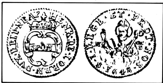
3. Le gros d'argent représentant Saint-Janvier