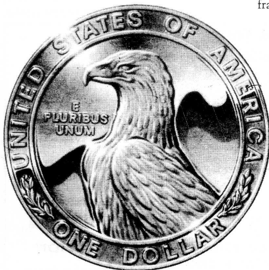
TYPE DEFINITIF de la future monnaie Olympique